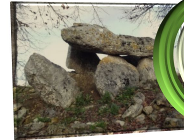
Dolmens de Sabatey