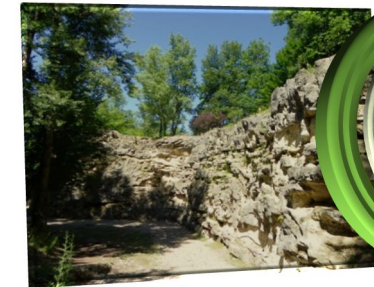
Falaise de La Lirette