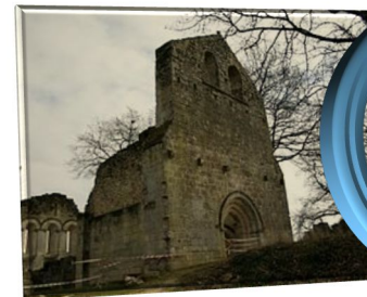
Commanderie de Sallebruneau