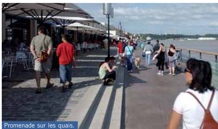
Promenade sur les quais.